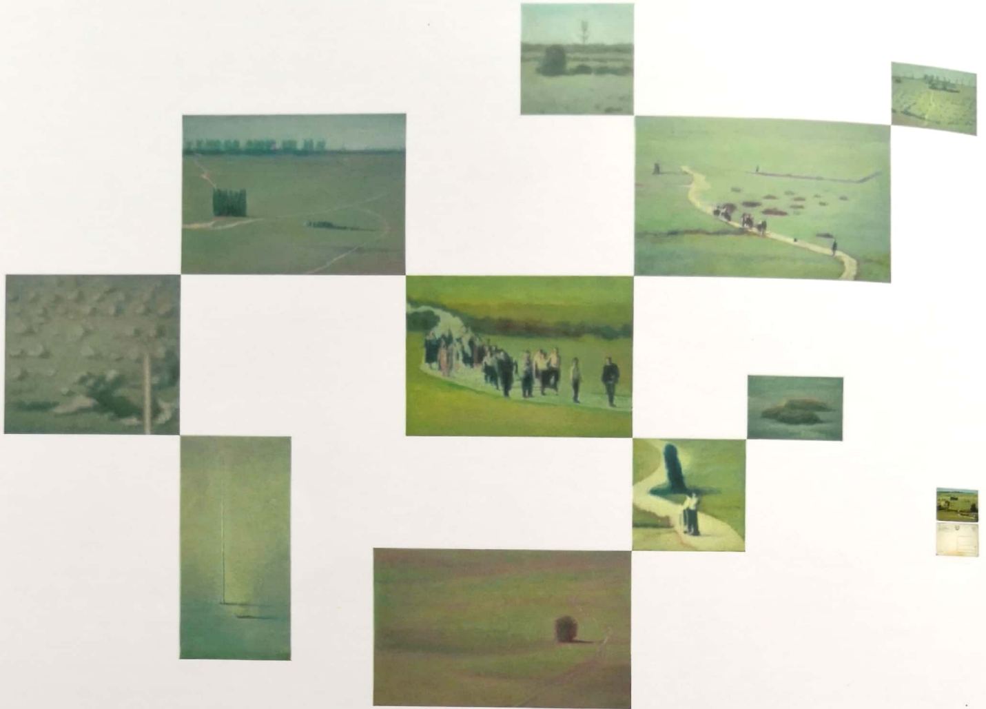
Szűcs Attila Képeslapok Lidicéből , 2003, olaj, vászon, 305x220 cm, installáció

Sem a sír és az azt jelző kereszt, sem a szobor-emlékmű nem szerepelnek a vásznanon. Első pillantásra ezt az emlékezésre nézve kifejezetten károsnak is érezhetnénk, ám paradox módon, a fent említett tárgyak, szimbólumok eltávolítása által épp az emlékezés aktivizálását éri el a művész. A fotón szereplő emberi alakok egyértelműen a sírhoz és a szoborhoz – vagyis a megemlékezés szimbólumaihoz – kapcsolódnak, jelenlétük pontosan a megemlékezés miatt indokolt.